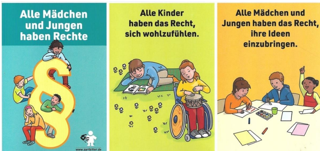
Abbildung: Auszug aus dem Kinderrechteheft und dem Kinderrechtepass, Zartbitter e.V.